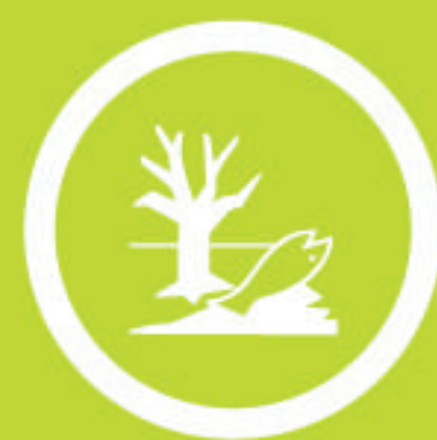
Risque de Pollution